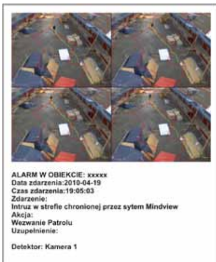
Raport ze zdarzenia wygenerowany przez system Mindview

Dystrybutor: Fortuna Communication, www.fortuna.pl